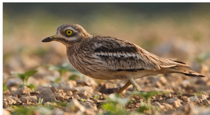
œdicnème criard

Il est migrateur partiel dans nos régions, c'est-à-dire qu'une partie des individus seulement partent hiverner en Espagne. De septembre à novembre, après la reproduction, les œdicnèmes forment des rassemblements pouvant dépasser la centaine d'individus.