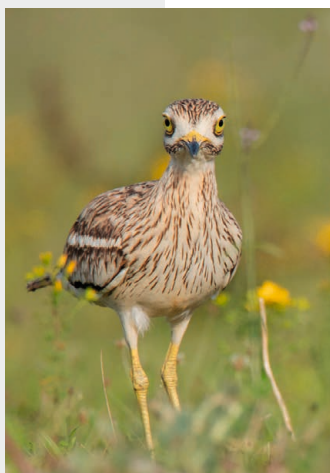
Ædicnème criard L'œdicnème criard est un oiseau emblématique des plaines charentaises.