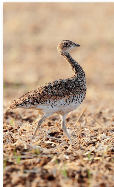
Femelle d'outarde canepetière

La plaine de Villefagnan héberge quatre espèces d'oiseaux vulnérables qui mobilisent des actions de conservation particulières : l'outarde canepetière, l'œdicnème criard, le busard cendré et le busard Saint-Martin.