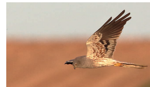
Mâle de busard cendré

Grands consommateurs de petits rongeurs qu'ils chassent sur les bords de champs et de parcelles herbacées, les busards sont de précieux alliés pour les agriculteurs : ils consomment environ 1 000 campagnols par couple et par an !