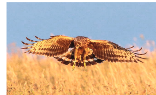
Femelle de busard Saint-Martin