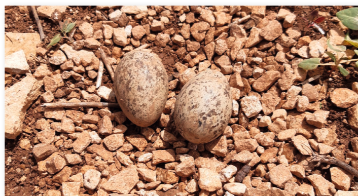
Nid d'œdicnème criard