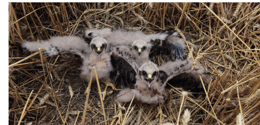
Poussins de busard Saint-Martin

Œufs, poussins et parfois adultes sont incapables d'échapper aux machines et peuvent être tués lors de travaux agricoles. En effet, jusqu'à 90 % des jeunes busards cendrés ne savent pas encore voler lorsque commencent les moissons des céréales. Le repérage des nids et la mise en place d'une protection sont donc des actions essentielles au maintien de ces espèces dans nos plaines.